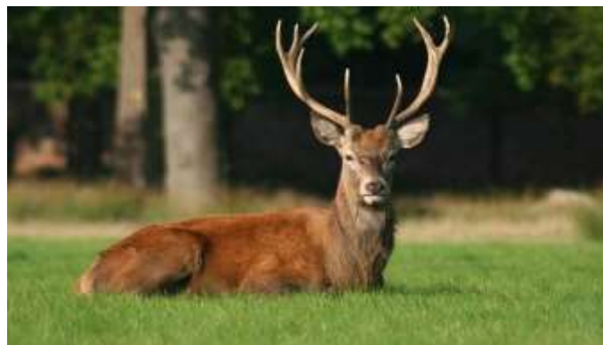
Gambar 1. Rusa/Menjangan hewan kesayangan dan dimuliakan oleh Mpu Kuturan

Keberadaan Pelinggih Menjangan Seluang di Bali tidak terlepas dari sejarah kedatangan Mpu Kuturan ke Bali yang berjasa menyatukan sekta-sekta menjadi satu paham Tri Murti. Sebagai wujud penghargaan terhadap beliau maka dibuatkan Pelinggih Menjangan Seluang. Selain karena kedatangan beliau ke Bali menunggangi hewan menjagan, rusa/ menjangan merupakan hewan kesayangan dan dimuliakan oleh Mpu Kuturan.