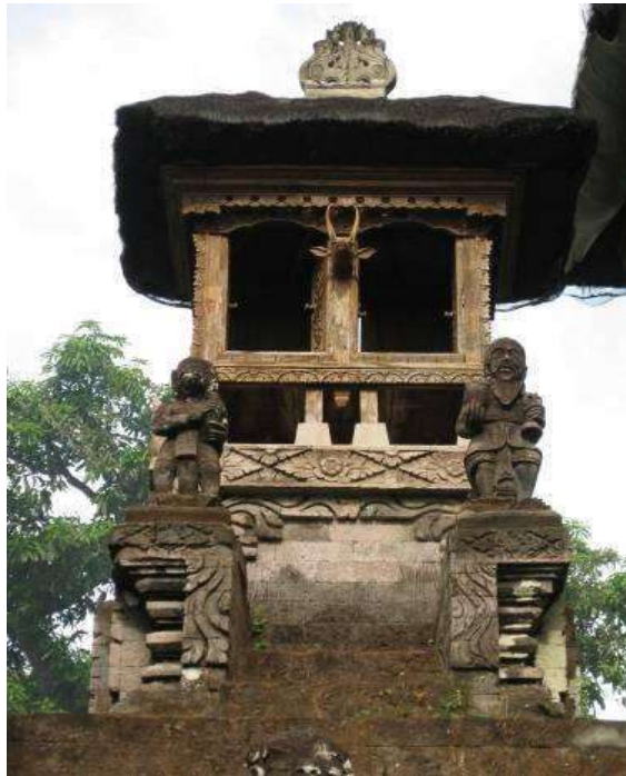
Gambar 3. Menjangan Saluang di Pura Beji Sangsit, Buleleng

Menjangan Seluang yang bentuknya panjang ini terdiri dari tiga ruang (rong) yang cukup besar. Rong pertama dan kedua hampir sama lebarnya kira-kira 75cm. Dalam rong yang besar yang ditengah, berisi kepala menjangan lengkap dengan tanduknya. Bentuk Menjangan Seluang rupanya memang dimaksudkan untuk menunjukkan adanya tiga kelompok besar masyarakat zaman dulu, dimana salah satu diantaranya yakni kelompok Bali Aga terdiri dari enam Sekta Agama.