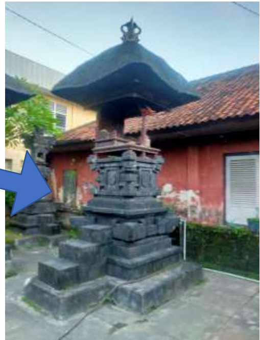
Gambar 2. Menjangan Saluang biasanya diletakkan di Merajan Gede / Sanggah Gede

Sanggah Gede yang memiliki Pelinggih antara lain, Padmasana, Kemulan Rong Tiga, Limas Cari, Limas Catu, Menjangan Seluang, Pangrurah, Saptapetala, Taksu, Raja Dewata.